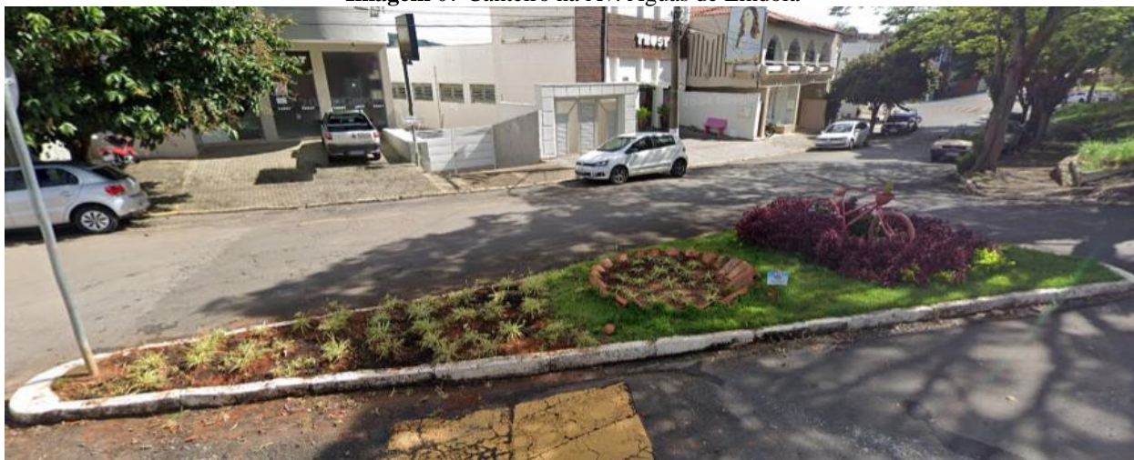
Imagem 07 Canteiro na Av. Águas de Lindóia