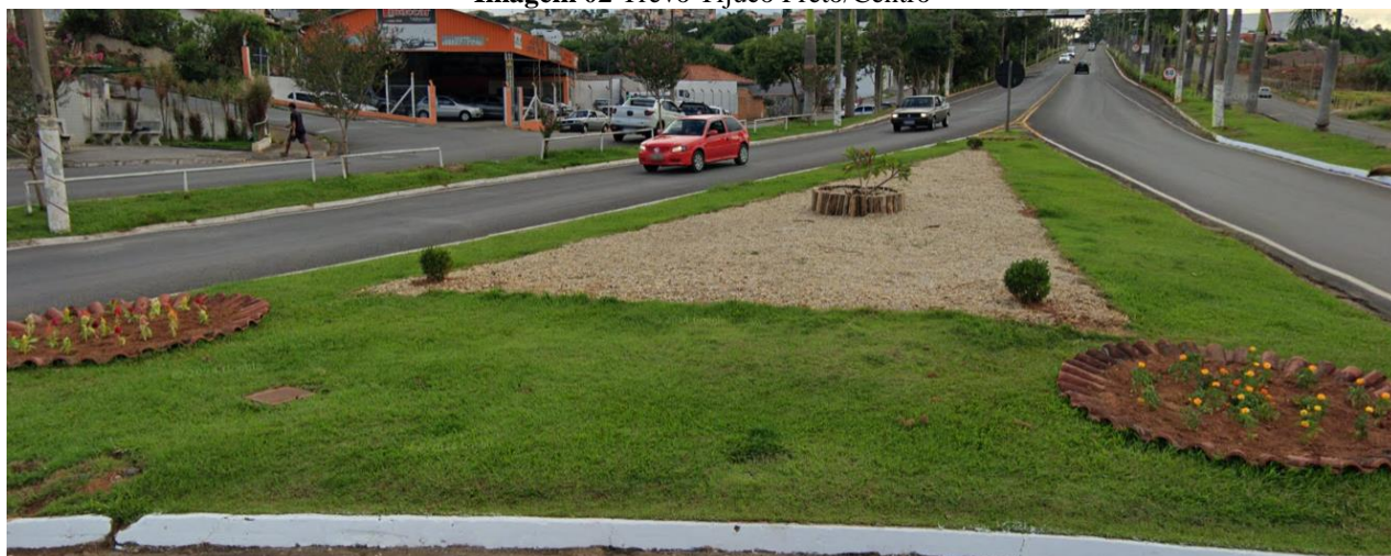
Imagem 02 Trevo Tijuco Preto/Centro