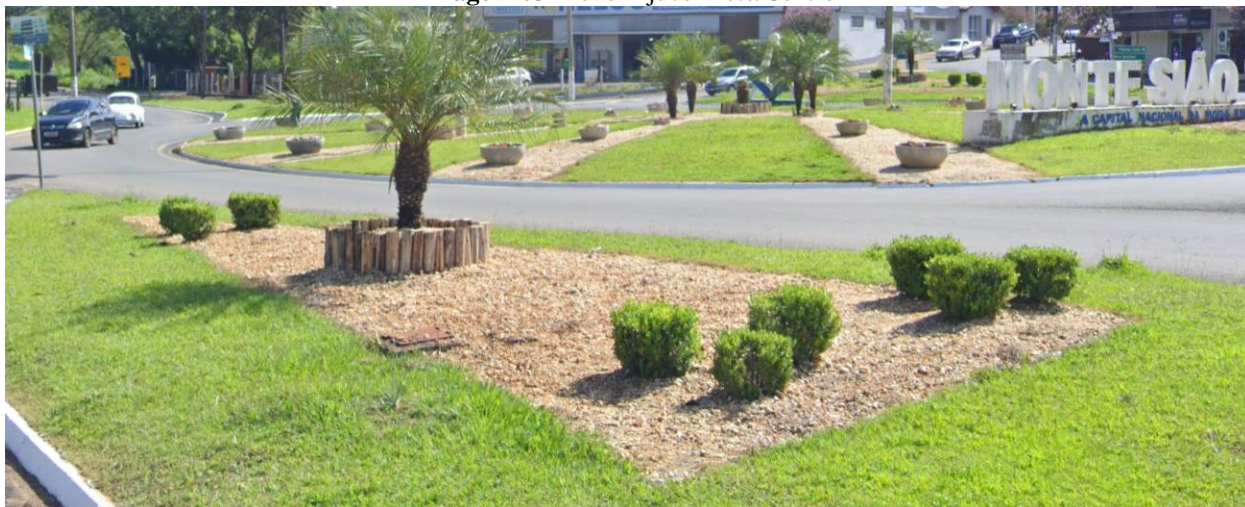
Imagem 03 Trevo Tijuco Preto/Centro

Rua Maurício Zucato, 111 – Centro, Monte Sião/MG. CEP 37580-000 Telefone (35) 3465-4600 – email: nucleocompras@montesiao.mg.gov.br