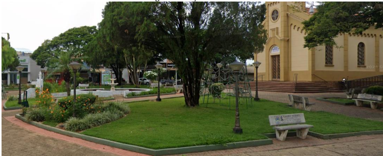
Imagem 05 Praça “do Rosário”