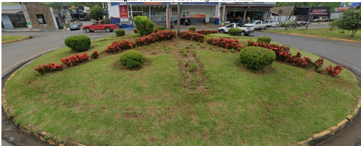
Imagem 08 Canteiro na Av. Águas das Fontes