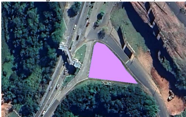
Imagem 10 Área de interesse (Lavandário)