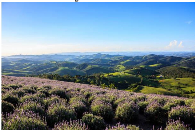
Imagem 09 Lavandário