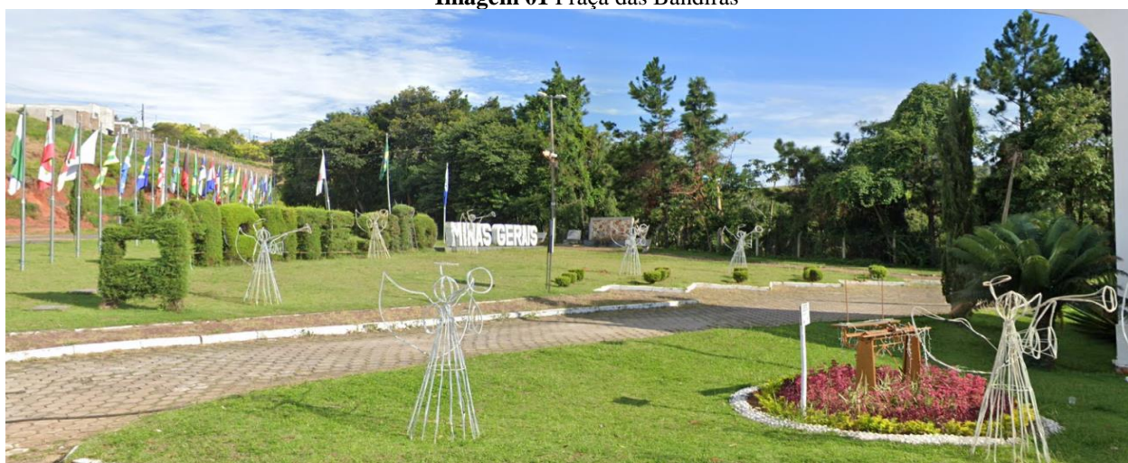
Imagem 01 Praça das Bandeiras

Entre os lugares que carecem dessas providências estão principalmente as praças, esses espaços de convivência comuns que integram o lazer e descanso, sendo esses ideais para a criação de ambientes acolhedores a moradores e turistas. Tal qual canteiros centrais, avenidas, calçadas e áreas de pedestres, onde centenas de pessoas transitam diariamente, com a expectativa de um visual harmonioso.